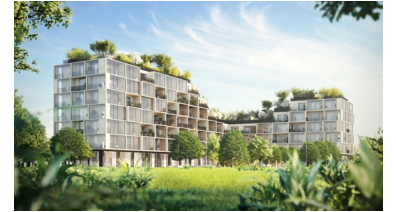
Dit Palazzo Verde komt in Nieuw Zuid.

Om dit imago in de verf te zetten is Stefano Boeri aangekomen als architect. Hij werd in 2014 beroemd met zijn Bosco Verticale in zijn thuisstad Milaan. Op twee woontoren van 110 en 76 meter hoog integreerde hij 900 bomen en 15.000 struiken. Zo was hij een van de