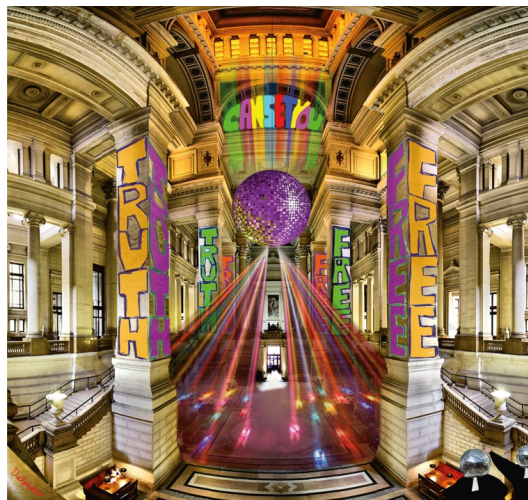
Met helle kleuren de negatieve energiering wegwerken.