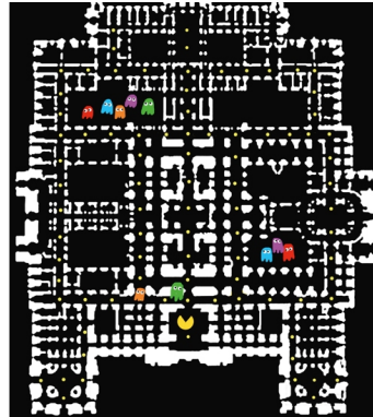
Het labirynth. ideale setting voor 'Pacman'. © Pascal Bernier