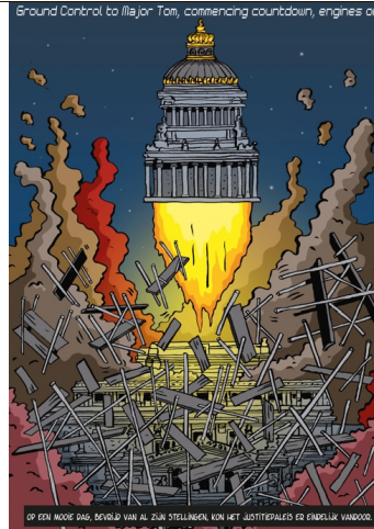
Bevrijd uit de stellingen!