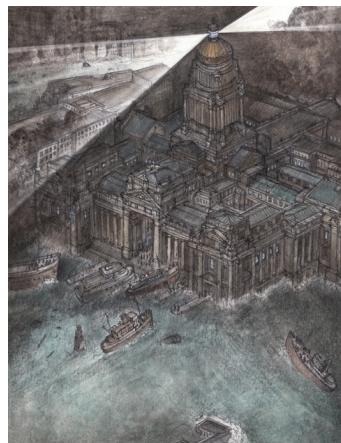
Als we het klimaat niet redden, meren we er straks aan.