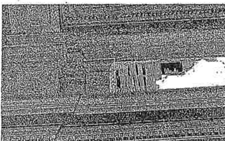
Vochtplekken teisteren de meeste gangen, sommige zalen zijn bijna te vochtig om nog te gebruiken.