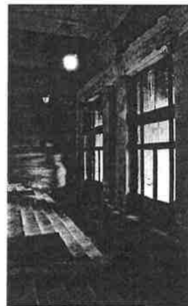
Een mastodont van een gebouw in erbarmelijke toestand.

'De manier waarop het Justitiepaleis de voorbije decennia onderhouden werd, is geen toonbeeld'