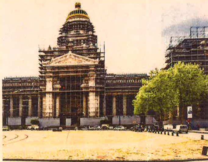
Les travaux de rénovation de l'intérieur du Palais de Justice devraient démarrer en 2020.

Ce travail a été commencé, mais nul ne sait trop bien sur quoi il va déboucher. Il faudra bien sûr que les magistrats et le personnel judiciaire aient trouvé d'ici là un autre toit vu qu'il est inimaginable que les travaux de restauration du Palais de Justice (la bâtisse est classée) puissent se faire alors que des audiences ont lieu. Bref, il faudra que les différentes pièces du puzzle puissent s'assembler harmonieusement.