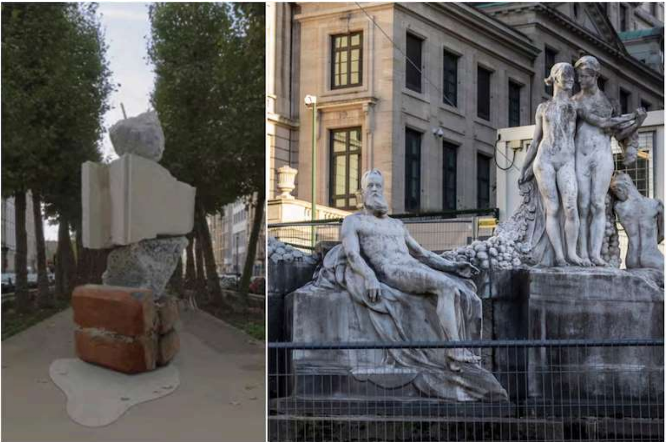
L'oeuvre "Rückbaukristalle" (inspirée de cette pièce, mais qui sera plus grande) viendra remplacer la sculpture "La Maturité", près de la gare Centrale.